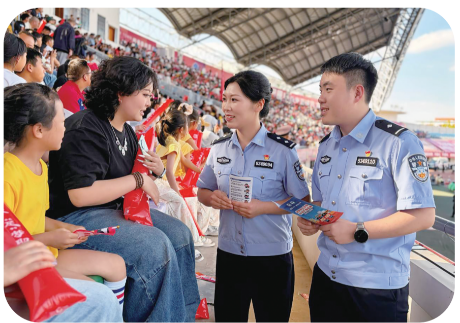
民警开展禁毒宣传。

坚持协同发力、共治共享,形成群防群治强大合力。昭通市强制隔离戒毒所着力构建多方联动的禁毒工作格局,推动禁毒责任向各行业延伸。通过深化“行业+禁毒”协作机制,联合卫健部门、医疗机构开展专场禁毒宣传,结合执法实践与临床医学知识讲清麻精药品严格管控的必要性与滥用风险,从源头防范药物滥用。联动公交、铁路、民航等交通行业打造流动禁毒宣传阵地,组织从业人员担任禁毒志愿者,向出行群众普及禁毒常识。联合本土企业推出禁毒主题