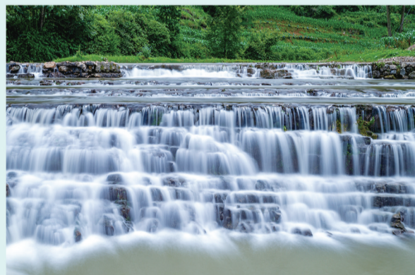
赤水河万卷书瀑布