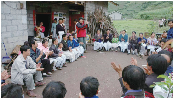
云南乌蒙山国家级自然保护区工作人员深入罗坝坝片区宣传森林防火。

薄雾如轻纱般笼罩着乌蒙山。天光未亮,小草坝管护站的无人机已率先掠过林海,将实时画面传回指挥中心。那些昔日需跋涉数日才能抵达的深谷险壑,此刻在“天空地”一体化监测网络的覆盖下一览无余。 时光回溯到2016年5月,云南乌蒙山国家级自然保护区管护局在4间临时借用的办公室内正式挂牌成立。这支国家级管护队伍成立之初,仅有15名工作人员。 2016年5月,云南乌蒙山国家级自然保护区管护局在临时借用的办公场所正式成立。15名工作人员、3块临时牌匾,便是这支队伍最初的全部配置。回望这段起步历程,彼时的他们面对这片莽莽群山,最深的感受或许可以用“一无所知”来形容。 “起初,山里究竟藏着多少‘生态家底’,谁心里都没数。”一位老员工回忆道。转折始于同年——随着首份《社会经济本底资源调查报告》与《资源补充调查报告》相继出炉,这片山林第一次拥有了属于自己的“生态户口簿”:一个保存完好的亚热带山地常绿阔叶林生态系统,2174种维管束植物在此繁衍生息。森林、溪流与万千生灵,终于从以往模糊的印象转化为清晰可查的数据。 2018年,《云南乌蒙山国家级自然保护区总体规划(2018—2027年)》在北京通过国家级评审,为保护区未来10年的科学化、规范化发展筑牢了根基。 自此,云南乌蒙山国家级自然保护区的守护体系开始落地生根、逐步完善。机构设置上,从3个临时工作组发展为6个职能科室;管护阵地建设上,4座管护站从规划蓝图变为山间坚实的据点;人员队伍也从最初的15人,壮大到57名职工和115名巡护员。数字增长的背后,是管护工作从零散点位到全域网络、从个人行动到体系化运作的深刻转变。 “人多了,管护站也建起来了,但巡山的路,每一步还得踏踏实实走。”职工老周的话,道出了管护工作变与不变的核心。10年间,许多事物都在改变:管护空间不断拓展,巡护装备持续升级,管护体系日益完善。始终不变的,是巡山路上必须踏实迈出的每一步,是守护者以初心丈量群山、以坚守承载使命的赤诚情怀。