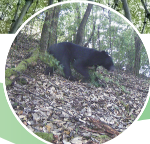
国家二级保护动物黑熊。