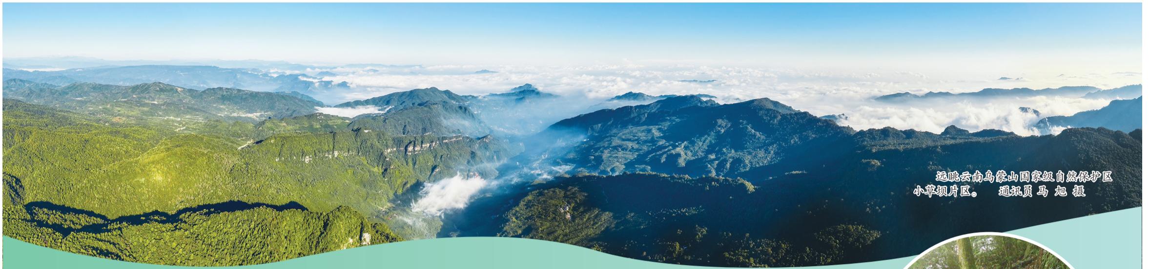
远眺云南乌蒙山国家级自然保护区小翠坝片区。