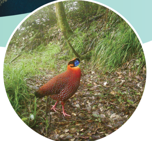
国家二级保护动物红腹角雉。

游筑牢生态安全屏障,还是为后世留存一份完整、鲜活、可持续的绿色遗产。” 十年耕耘,从擘画蓝图到绿意铺展,从夯实基础到引领示范,乌蒙山的生态实践已然成为中国生态文明建设宏大图景中的一抹亮色。 未来,这里的每一声鸟鸣、每一片新绿、每一次数据跳动与脚步回响,都将共同续写一个关于古老山脉在新时代,如何通过人类的敬畏、智慧与坚守,重焕生机并永久守望的故事。 这故事,属于乌蒙群山,属于长江流域,也属于我们共同追求的生态未来。