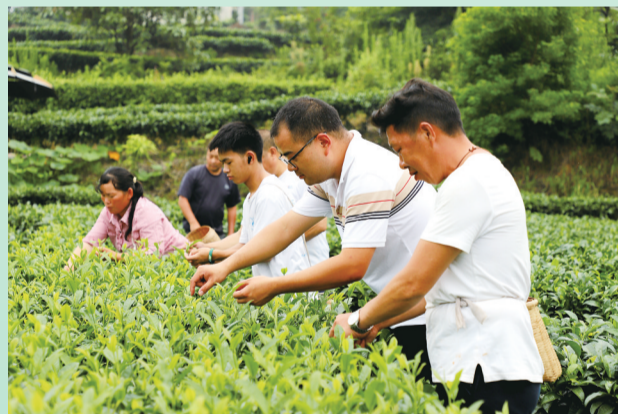
当地茶农正在采摘茶叶。