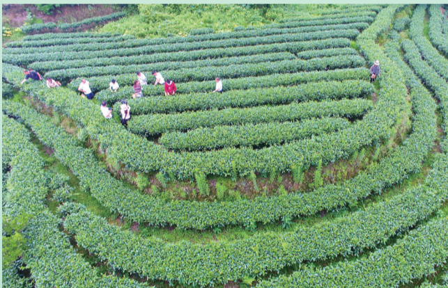
保宁村茶叶种植基地生机勃勃。

依托“统一技术指导、统一质量管控、统一销售渠道”的运营模式,保宁村的茶叶、蚕茧、粉条逐步走出大山,走向更广阔的消费市场。