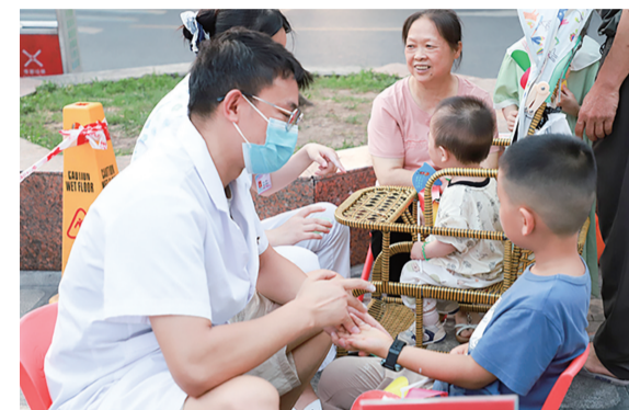
医护人员为小朋友推拿调理。

本报讯(通讯员李明峻 刘思辰文/图)针对上班族无暇就医、群众妇幼健康咨询不便等民生难题,水富市妇幼保健院创新推出为期一个月的夜间义诊活动,通过错峰延时、下沉基层的服务模式,填补夜间妇幼健康服务空白,切实破解群众“上班族、看病难”问题。