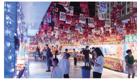
盐津县黄葛槽新区热闹的夜市。

本报讯(通讯员吉秋园文/图)近日,在盐津县黄葛槽新区广场上,来自四川泸州的“打铁花”非遗传承人赵海峰率团队,为当地群众带来了一场震撼的视觉盛宴。