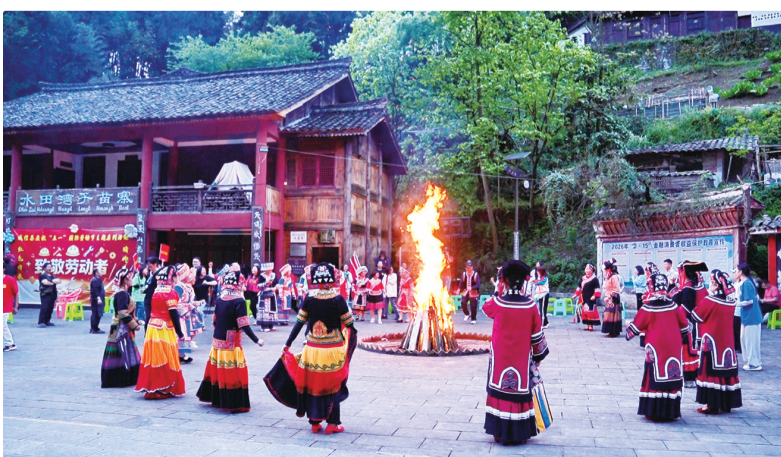
威信湾子苗族篝火联欢。

为促农增收的强力引擎。一幅“以旅促农、以旅富民”的乡村振兴美好画卷,正在革命老区徐徐展开。