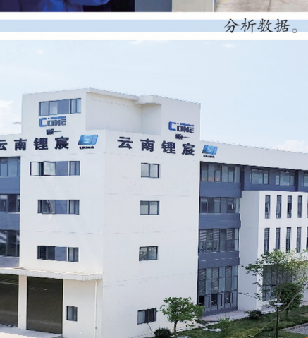
云南锂宸新材料科技有限公司一角。