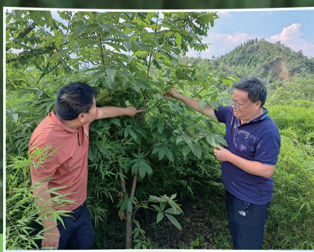
笋竹科研团队查看在笋竹林中套种的黄柏生长情况。