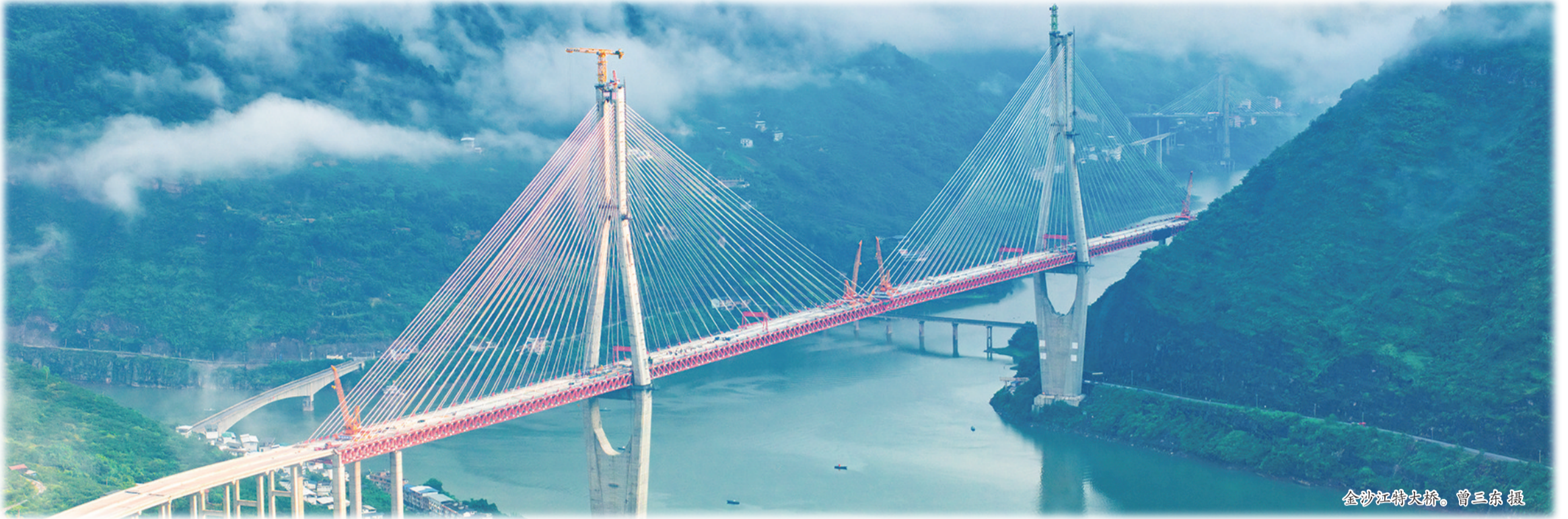
金沙江特大桥。曾三东摄

2025年,昭通市县域经济发展实现标志性突破——鲁甸、盐津、威信、水富4个县(市)成功跻身GDP“百亿俱乐部”。至此,昭通“百亿县”总数达到9个,县域经济整体实力迈上新台阶。这并非单一产业的偶然爆发,而是一场立足资源禀赋、聚焦特色产业、强化工业支撑、融入开放经济的系统性突围。昭通正以城乡融合为路径,推动县域经济从“多点开花”迈向“全域繁荣”,为西部地区县域高质量发展探索出一条特色路径——