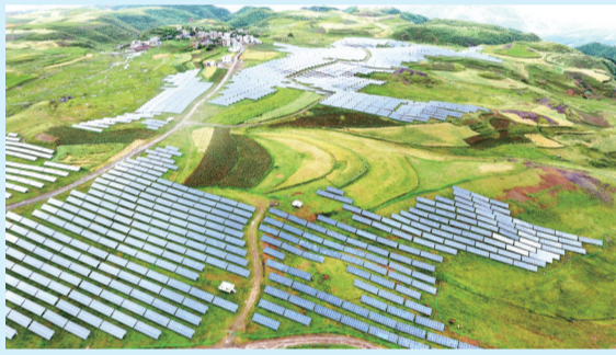
鲁甸光伏发电基地。丁世新摄