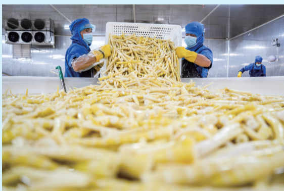
盐津竹产业。