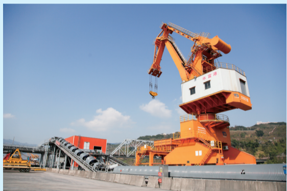
“万里长江第一港”——水富港。