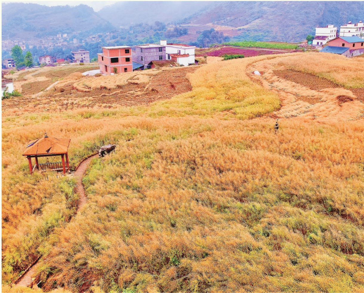
盐津普洱万亩油菜籽喜迎丰收