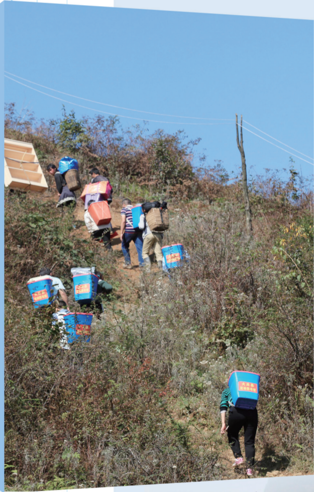
▲2016年10月22日,大关县“背篋图书馆”志愿服务队开展巡回送书活动。