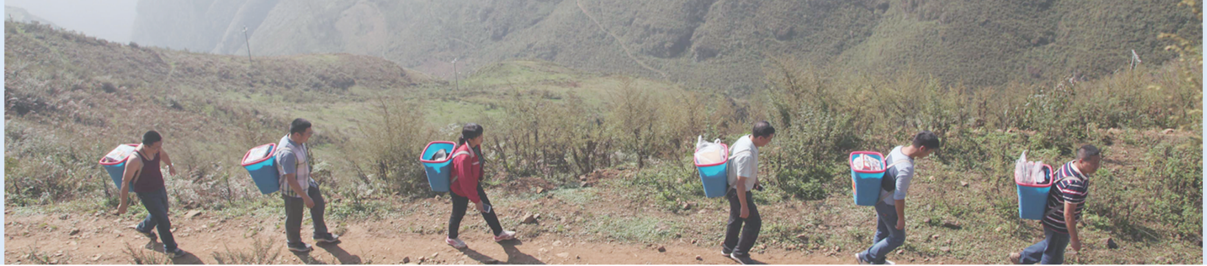
►2016年10月22日,大关县“背篋图书馆”志愿服务队为悦乐镇新寨村海坝苗寨的群众和孩子们送图书。