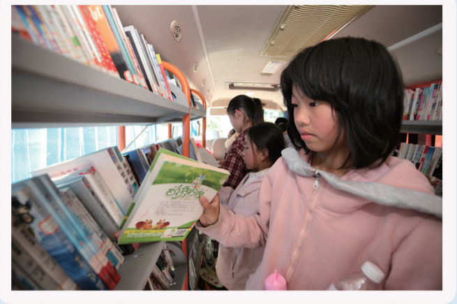
2026年4月18日,大关县玉碗镇出水源社区,孩子们在挑选喜欢的书籍。