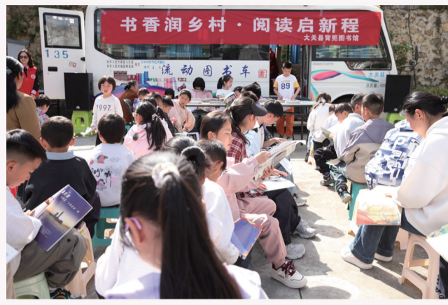
2026年4月18日,大关县玉碗镇出水源社区,孩子们在“流动图书车”前读书。