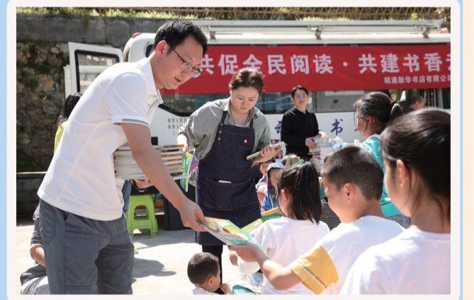
2026年4月18日,大关县玉碗镇出水源社区,“背篋图书馆”志愿服务队队员为孩子们分发图书。