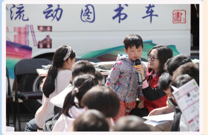
2026年4月18日,大关县玉碗镇出水源社区,“背篋图书馆”志愿服务队队员和孩子们进行阅读互动。

如今,大关县“背篋图书馆”已成为乡村公共文化服务的标杆品牌,不仅见证了基层文化工作者的坚守与奉献,还彰显出文化赋能乡村发展的强大力量。在全面推进乡村振兴的进程中,我们需要更多这样扎根基层、坚守初心、与时俱进的文化惠民项目——以书香为桥,打通公共文化服务“最后一公里”,用文化力量滋养乡村、启迪民心,让文明之花在乌蒙深山长久绽放。