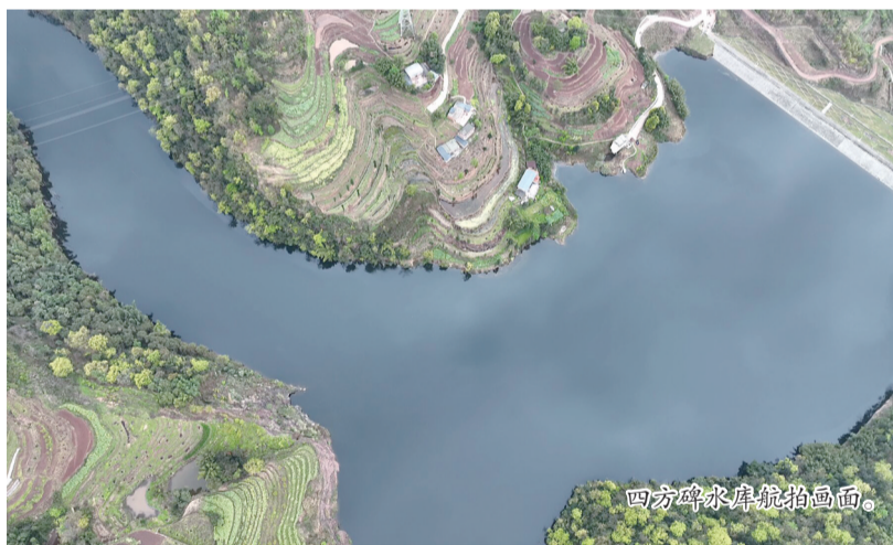
四方碑水库航拍画面。

此次访谈的成功举办,离不开昭通学院、昭通供电局、昭通新华书店有限公司的鼎力支持,三方立足自身职能,为活动搭建优质平台、凝聚多方力量,助力昭通挖掘文学价值、激发文旅活力。