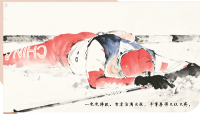
一次次摔跤,雪没沾满裤腿,手掌磨得又红又疼。