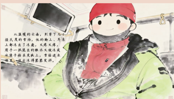
从温暖的云南,到零下几十摄氏度的赛场,他的脚上、耳朵上都涂出了冻疮,又疼又痒。用手一抹流出的汗水又被冻成冰渣子粘在脸上,雪鞋连走路都变得瑟瑟发抖。