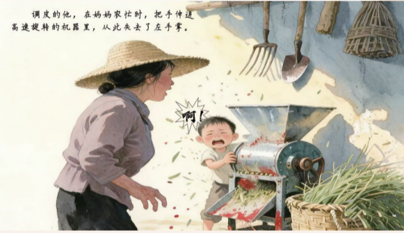
调皮的他,在妈妈家帮忙时,把手伸进高速旋转的机器里,从此失去了左手掌。