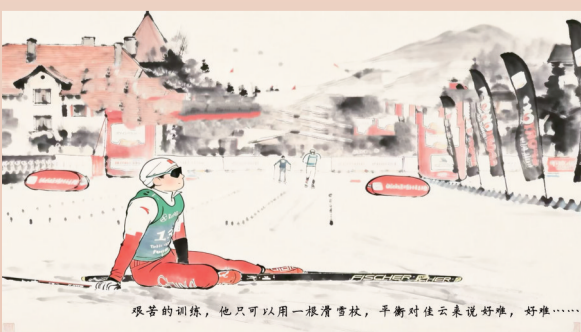
艰苦的训练,他只能用一根滑雪杖,平衡时使出来花好难,好难……