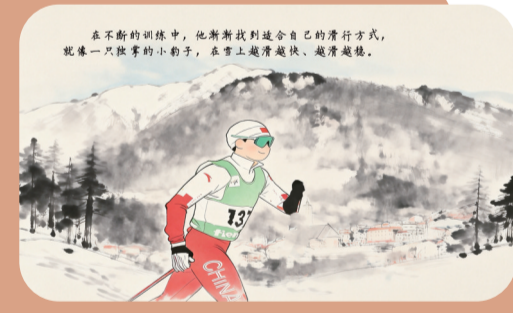
在不断的训练中,他渐渐找到适合自己的滑行方式,就像一只独掌的小豹子,在雪上越滑越快、越滑越稳。