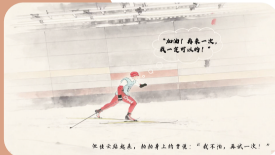
“加油!再来一次,我一定可以的!”