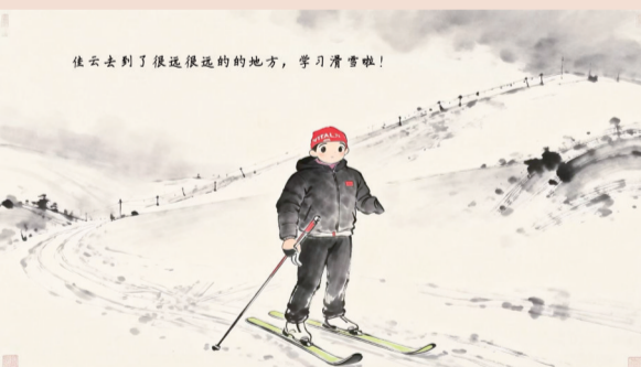
佳云去了很远的地方,学习滑雪啦!