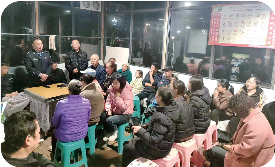
社区工作人员携辖区民警开展普法宣传活动。

心里这口气不顺,觉得亲情被忽视了。”了解到他的真实想法后,工作人员顺势引导,劝他多体谅婶娘的难处,珍惜血脉亲情。刘洪云当场表示愿意接受调解。与此同时,工作人员也多次找到刘春鸿,一边开展普法教育,一边进行思想疏导。如今,刘春鸿已很少饮酒,也未再出现言语过激的行为。