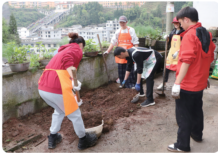
村干部与驻村队员一起帮助群众修整院坝。