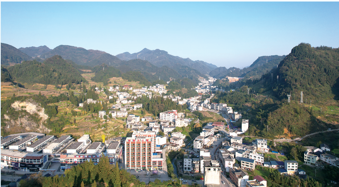
远眺石龙社区。