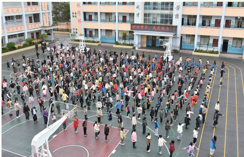
坡头镇第一小学课间操。

近日,昭通市融媒体中心记者走进坡头镇第一小学蹲点采访,深入挖掘学校以红色文化赋能教学发展、以民族团结教育为支点撬动乡村教育振兴的教学特色与亮点,并形成系列报道,以飨读者。本版为该系列报道之一。