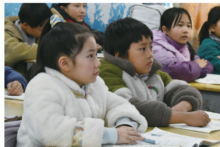
学生认真听课。 记者 田朝艳 摄