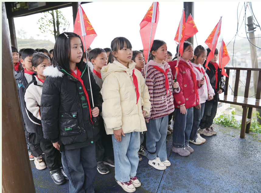
坡头镇第一小学开展“行走”的思政课。