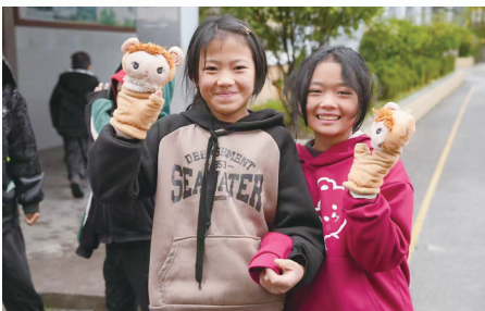
好朋友一起合影。