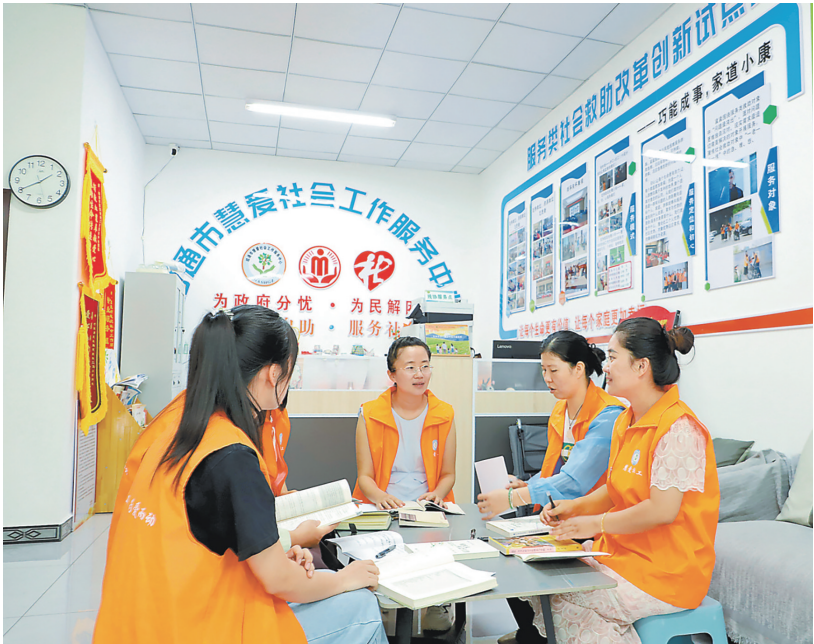
社工们互相分享经验。