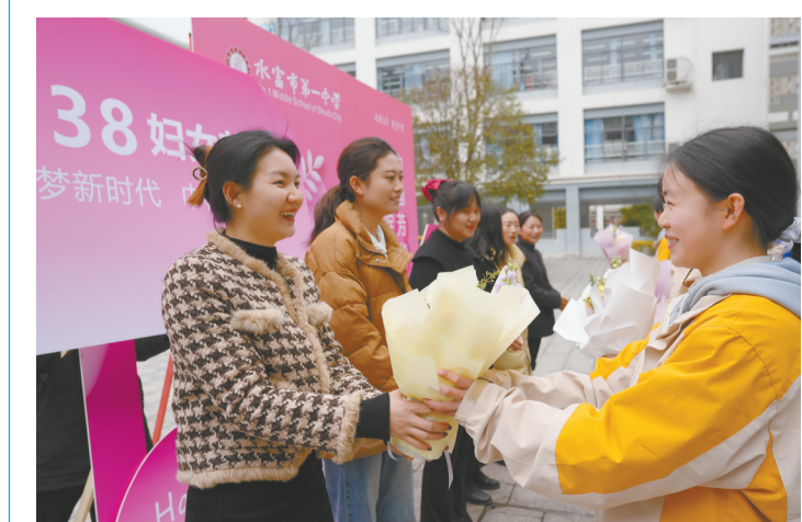
3月7日，水富市第一中学开展“巾帼芳华·魅力绽放”系列活动，庆祝“三八”节。图为学生向女教师献鲜花。

会议要求，全市能源系统要抢抓机遇、锚定目标、勇挑重担，高质量抓抓实，全力推动昭通能源事业高质量发展。