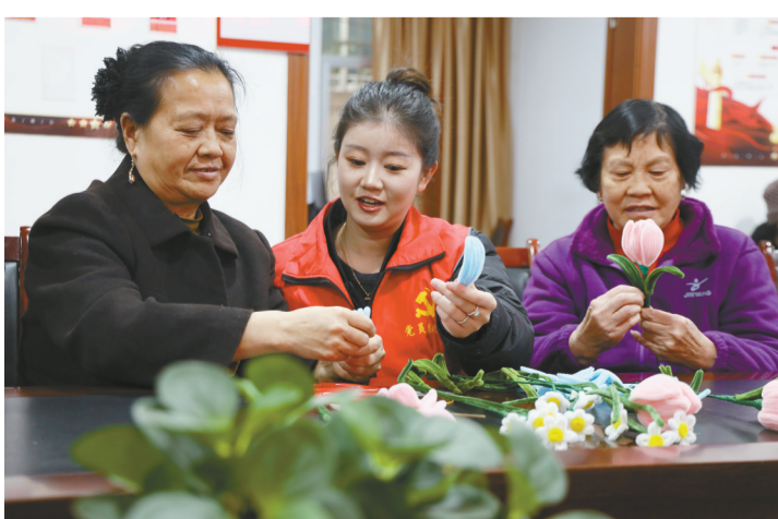
近日，彝良县角奎社区开展三八妇女节主题活动。