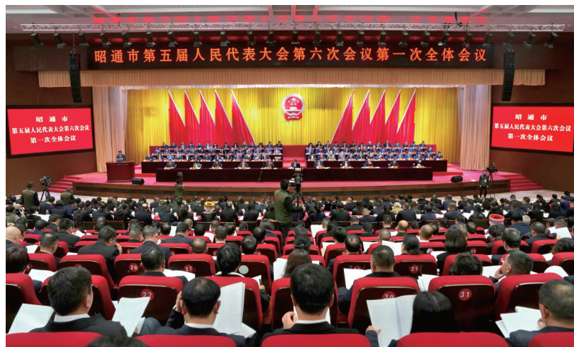
2月15日下午,昭通市第五届人民代表大会第六次会议在昭阳开幕。