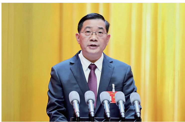
杨承新作政府工作报告。