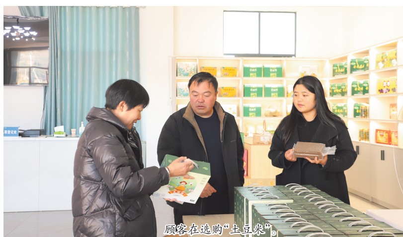
顾客在选购“土豆米”

下一步,公司将在确保安全生产的前提下,通过“832”消费扶贫平台、京东、淘宝、拼多多、抖音等线上渠道进行销售,并积极拓展线下销售渠道,以满足春节年货市场的消费需求。