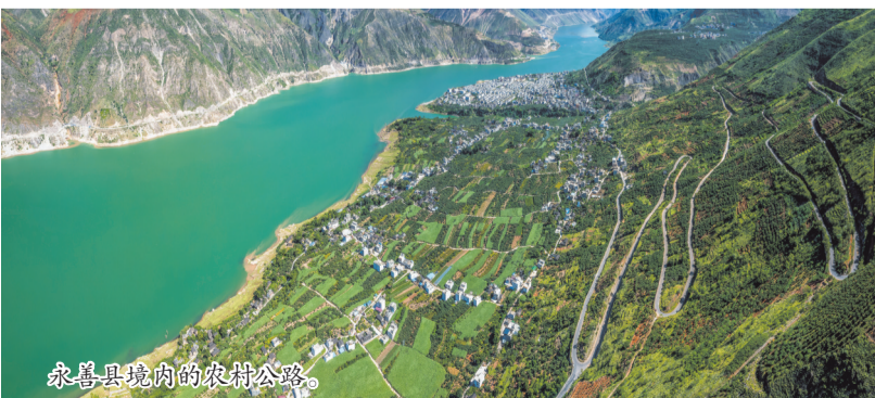
永善县境内的农村公路。

提振了村民增收致富的信心。 近年来,大关县将农村公路建设作为巩固拓展脱贫攻坚成果同乡村振兴有效衔接的重要工程,不断优化以县城为中心、乡镇为节点、村组为网点的农村公路交通网络。目前,全县已实施农村公路硬化工程1100余公里,公路硬化率大幅提升。 依托农村公路通达的交通优势,大关县充分融合客、货、邮三种运力资