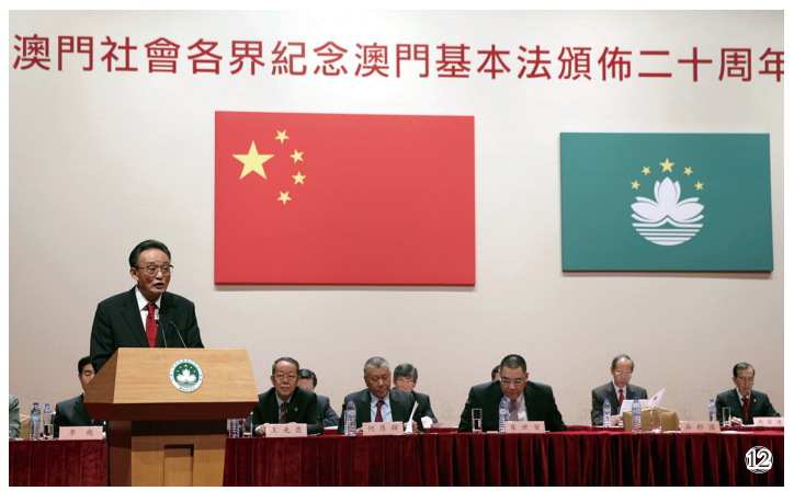
图⑫:2013年2月21日,吴邦国同志在澳门文化中心出席澳门社会各界纪念澳门基本法颁布20周年启动大会并发表讲话。