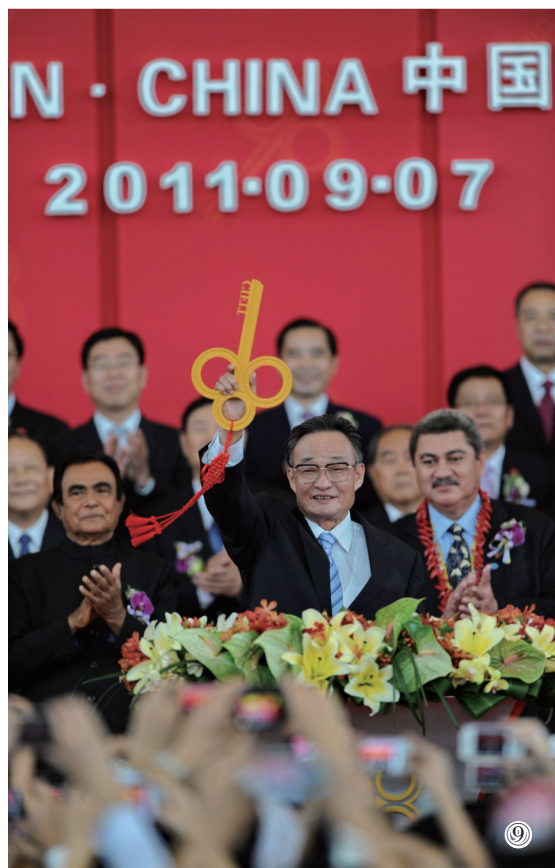
图⑨:二〇一一年九月七日,吴邦国同志在福建厦门出席第十五届中国国际投资贸易洽谈会开幕式。