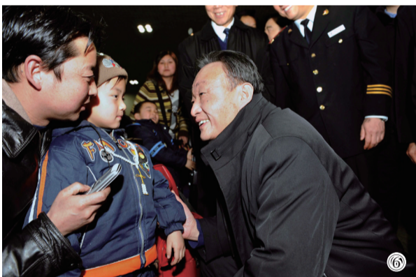
图⑥:2008年2月3日,吴邦国同志在北京西站候车室与旅客交谈。