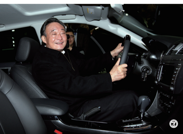
图⑦:2010年1月30日,吴邦国同志在上海汽车集团股份有限公司技术中心察看新能源样车。