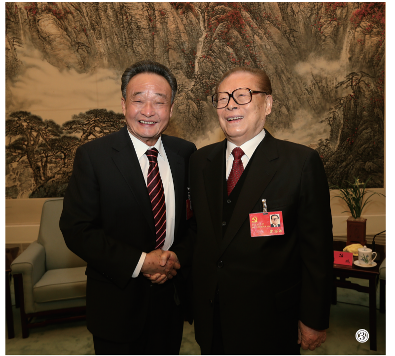
图③:2012年11月14日,中国共产党第十八次全国代表大会在北京闭幕。这是闭幕会前,江泽民同志与吴邦国同志在一起。