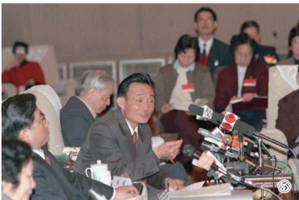
图⑤:1994年3月,时任上海市委书记的吴邦国同志在全国两会上海代表团团会上。