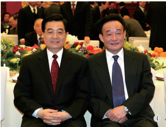
图④:二〇〇五年一月一日,全国政协在北京举行新年茶话会。这是胡锦涛同志与吴邦国同志在一起。