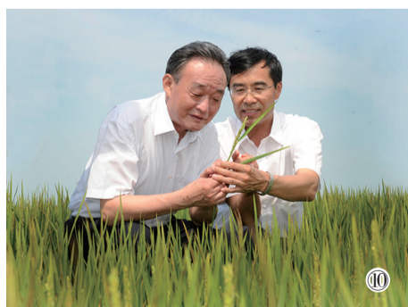
图⑩:2012年7月19日,吴邦国同志在黑龙江农垦建三江管理局二道河农场万亩大地号察看水稻长势。