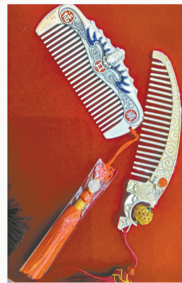
蝙蝠(福)银梳、吉象(祥)银梳。

“我有双饮盃,其银得朱提。”当今,人们也许只知昭通曾以朱提银著称于世,却不知朱提银具体产于何处。