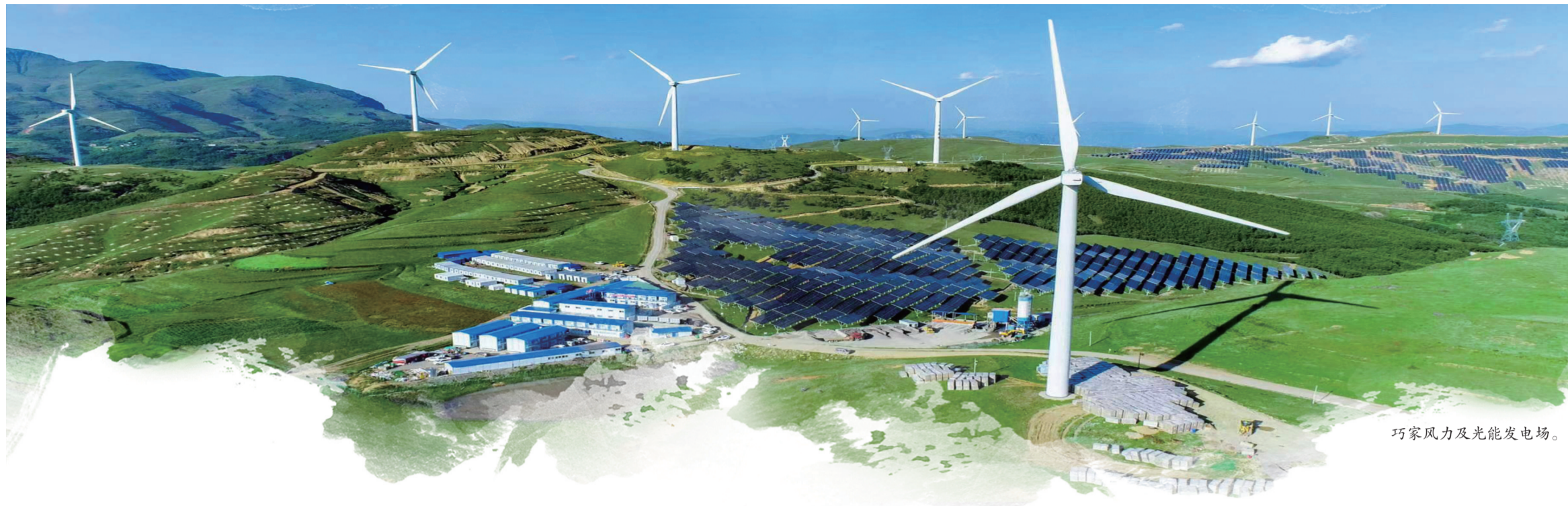
巧家风力及光能发电场。