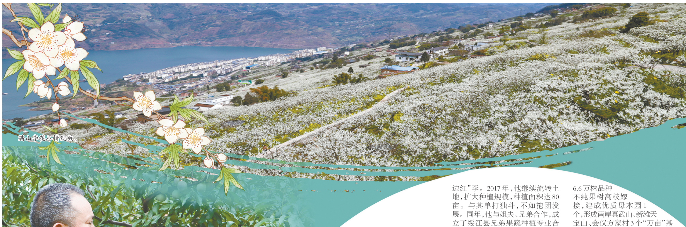
满山李花尽情绽放。