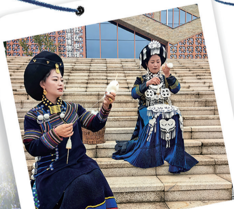
国家级非物质文化遗产——彝绣。