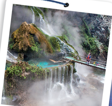
隐藏在绿水青山间的螺髻九十九里温泉瀑布，有“中国最美温泉旅游景区”的美誉。