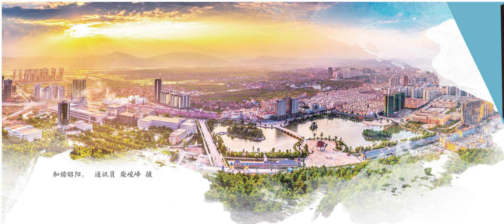
和谐昭阳。