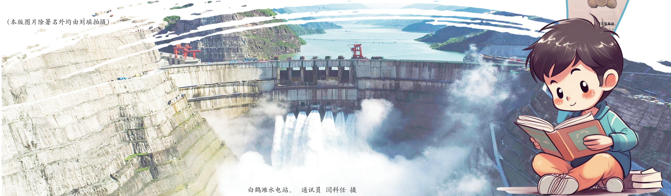
白鹤滩水电站。