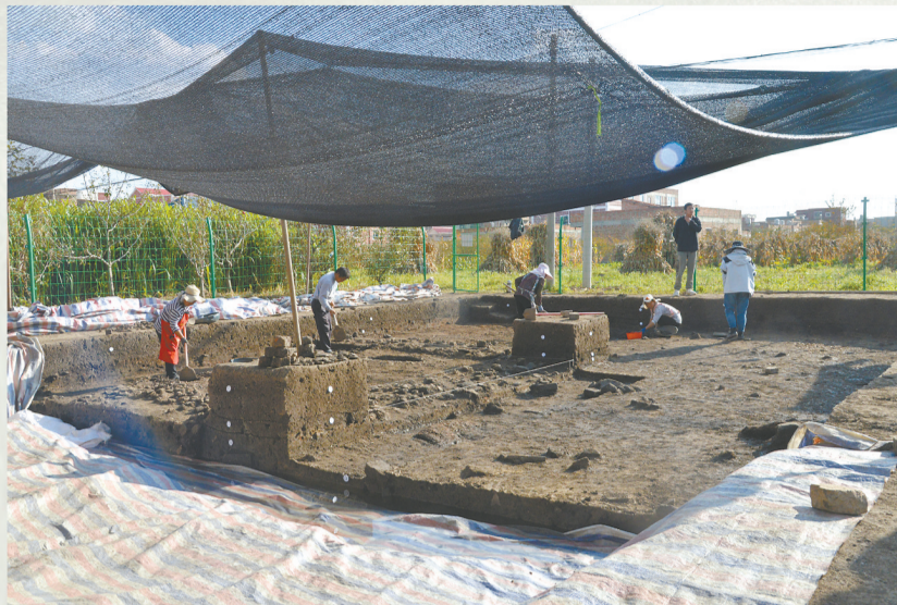
朱提故城考古发掘I区现场。