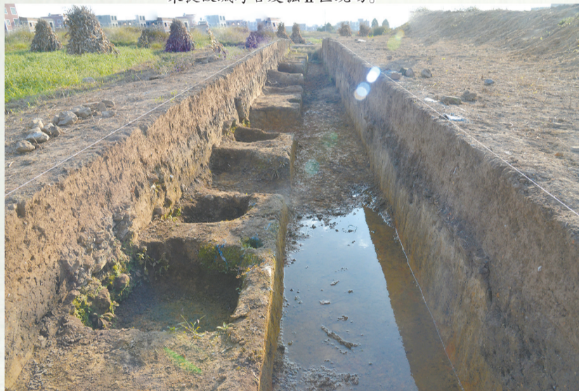
朱提故城考古发掘III区现场。