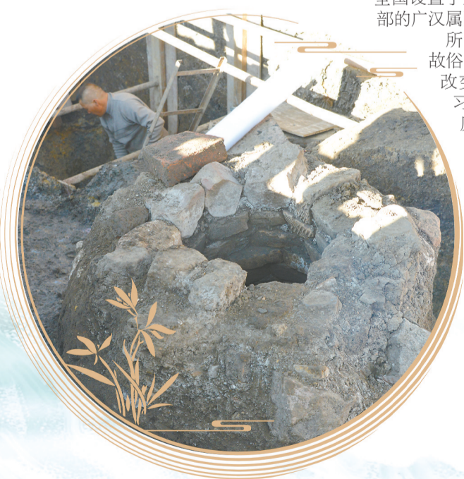
朱提故城遗址发现的水井。