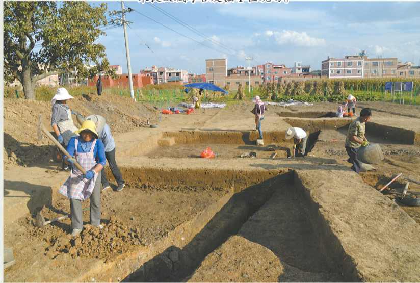
朱提故城考古发掘II区现场。