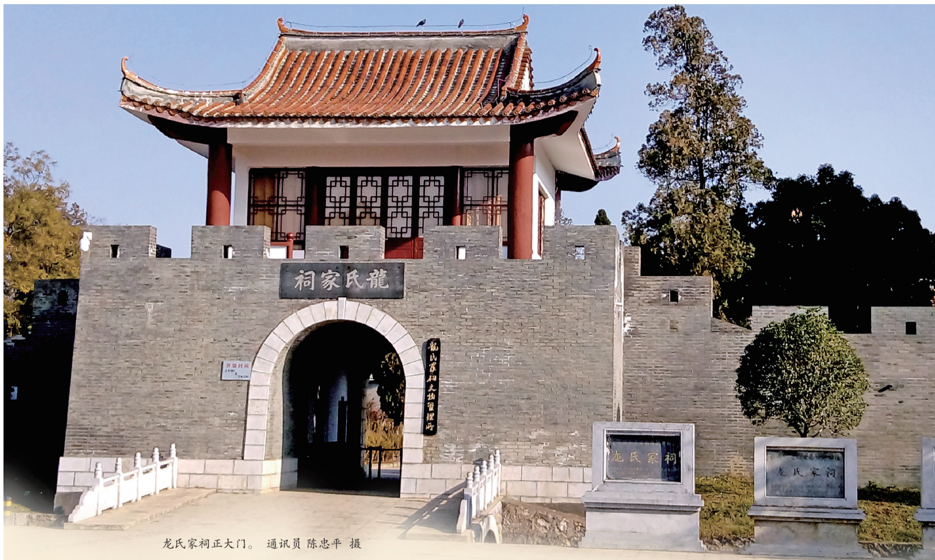
龙氏家祠正大门。