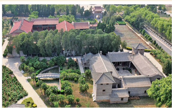
龙氏家祠全貌。