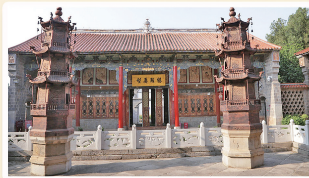
龙氏家祠中精湛的木雕。