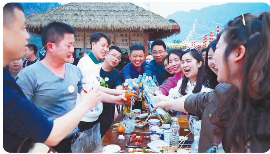
游客在林家坝啤酒音乐节上开怀畅饮。