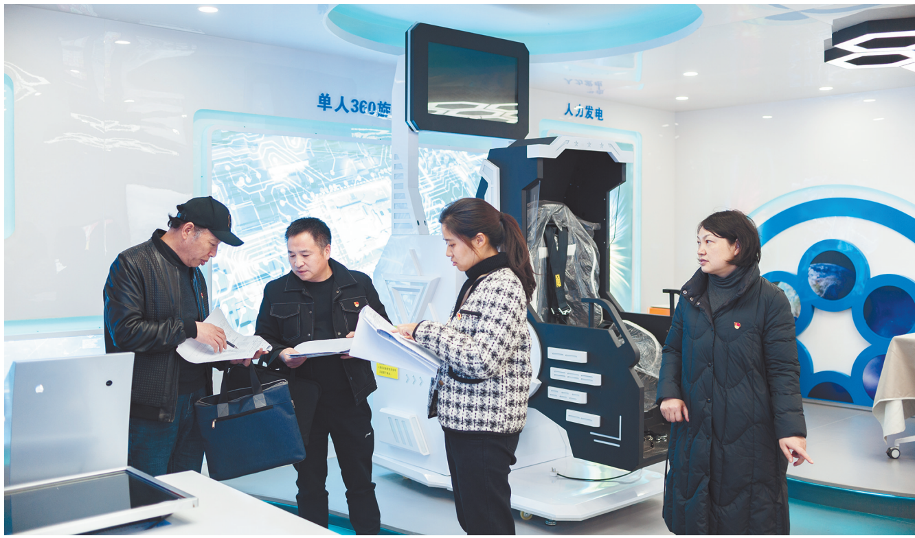
水富市坚持把发现问题贯穿巡察工作始终,通过实地检查、对照台账、现场盘点等方式,紧盯项目建设、政策落实中存在的问题,确保不放过一个细节、不遗漏一个线索。图为水富市委第二巡察组实地查看新寿村研学中心项目建设情况。