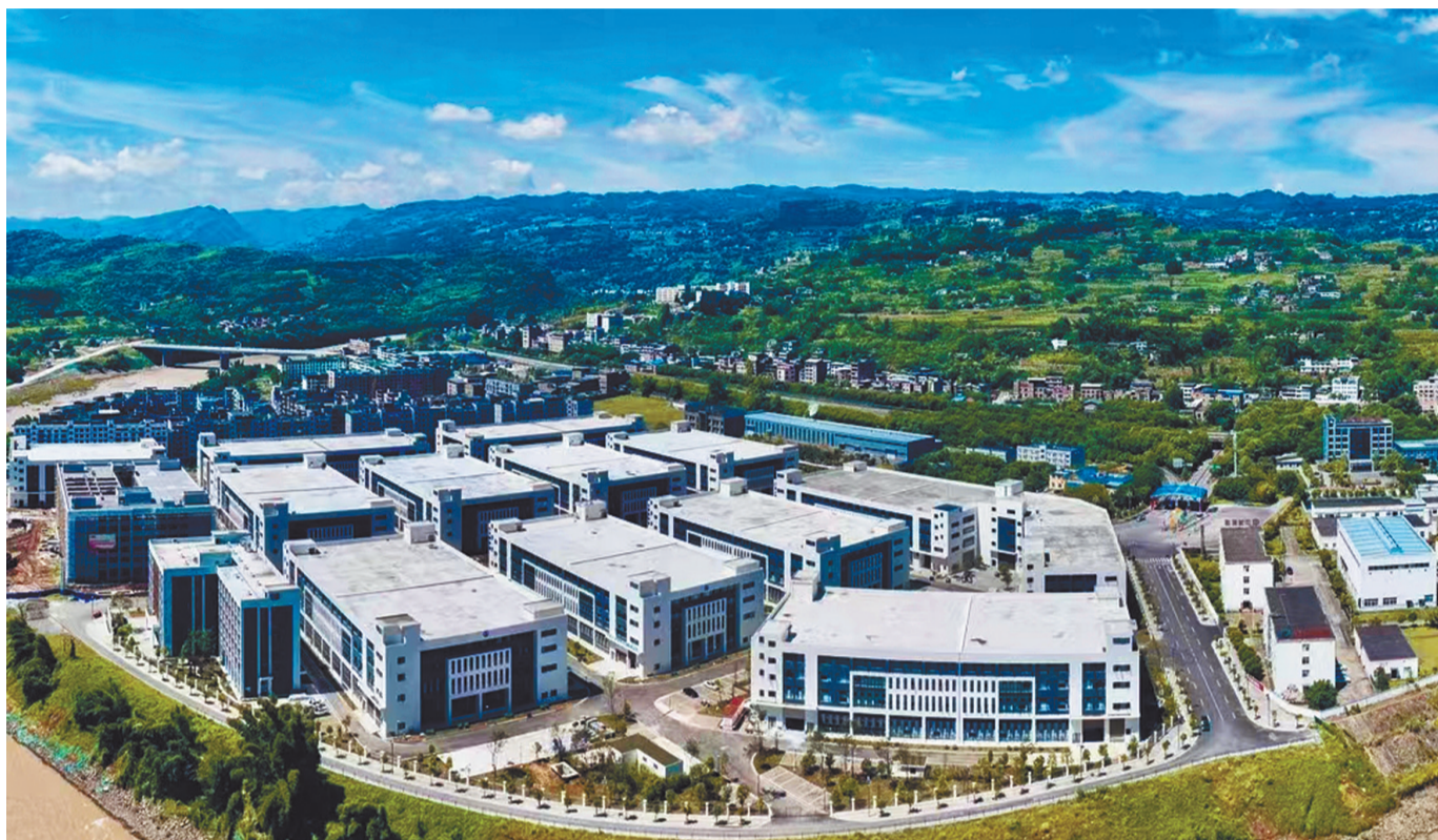
水富经开区楼坝片区标准化厂房航拍。

水富抓住国家、省、市加快培育新能源产业集群发展机遇,把握宁德时代布局宜宾,逐步构建完整的新能源电池产业链体系的区域化辐射机遇,布局水富港、临港物流园、新能源电池材料产业基地,主导发展新能源电池材料产业。锚定打造国家级新能源电池材料主要供给地之一的目标,把产业强市作为“一号战略”,把招商引资作为“一把手工程”,把优化营商环境作为“一号改革工程”,“举旗”发展新能源电池材料产业,实现新能源电池材料产业从无到有,带动全域经济向高质量发展迈进。目前,水富经开区入驻企业33家(规上企业18家),2022年实现工业总产值95.61亿元,同比增长23.32%;完成主营业务收入88.8亿元,同比增长14.95%。云南中晟新材料有限责任公司拥有发明专利1项,实用新型专利14项,先后被认定为国家级专精特新“小巨人”企业、国家高新技术企业、云南省科技型中小企业。云南锂宸新材料科技有限公司与宁德时代、比亚迪等深度合作,产品氧化亚硅用于动力电池上的硅基负极新型材料,突破了动力