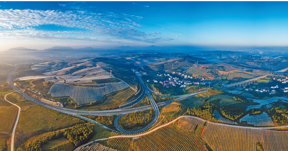
高速公路、乡村公路纵横交错。