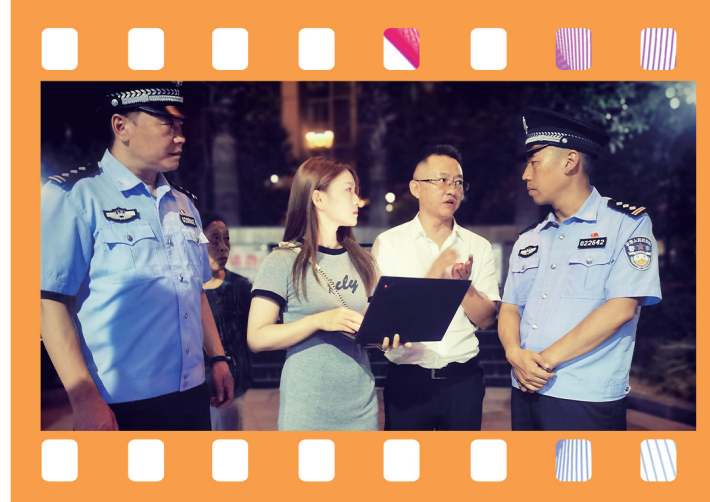
千警深入一线调研。