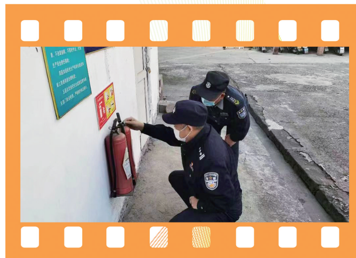
检查小区消防设施。

掌上警务送到家。在“天翼智慧社区平台”搭建“网上虚拟警务室”,适时推送“互联网+公安政务服务”的各类业务办事流程和所需材料,受理群众报警、求助,为市民和单位办理有关证件、证明提供咨询、便民服务。深度整合水、电、气等民生信息,对小区群众年龄、职业、出入门禁次数等信息进行大数据分析,有针对性地向社区群众提供法治宣传、及时救助等服务,让群众切切实实享受到智慧安防小区建设的红利。截至目前,为群众提供咨询268次,帮助解决问题115个。