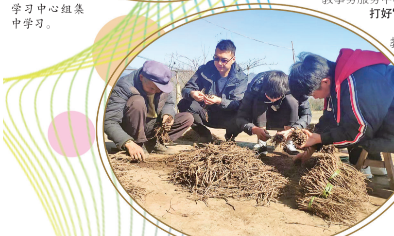
市公安局驻村工作队帮助村民采收党参。