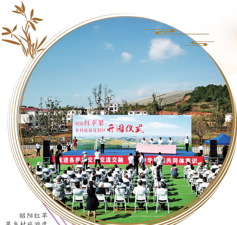
昭阳红苹果乡村旅游度假区开园。

责编:毛利涛 美编:张晓 组版:李章会 校对:王文富 E-mail:ztrbtb@126.com