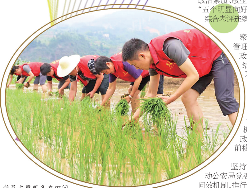
党员志愿服务在田间。