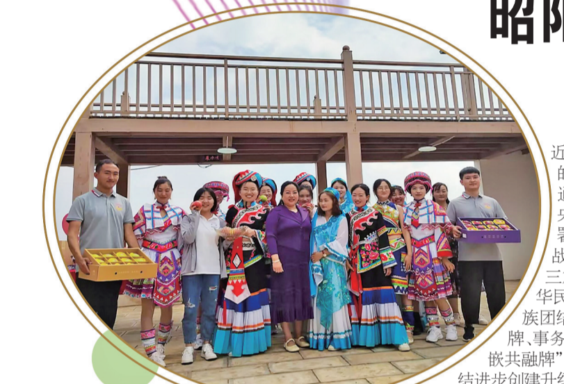
多民族电商共同助力苹果销售。

近年来,昭阳区委深入贯彻落实习近平总书记关于加强和改进民族工作的重要思想及考察云南特别是视察昭通的重要讲话精神,全面贯彻落实中央、省、市关于民族团结进步创建的部署,聚焦省委“3815”战略、市委“六大战略”发展目标,扎实做好“产、城、人”三篇文章,昭阳“五区”建设,以铸牢中华民族共同体意识为主线,突出昭阳民族团结进步品牌创建,积极打好“党建引领牌、事务治理牌、产业培育牌、宣传引领牌、互嵌共融牌”五张牌,着力打造新时代昭阳民族团结进步创建升级版。