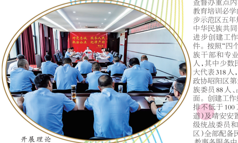
开展理论学习中心组集中学习。

坚持从空间、文化、经济、社会、心理上强化“融”的导向,出台各民族交往交流交融“三项计划”及“石榴红”工程实施方案,不断拓展各民族间交往交流交融的广度和深度。空间互嵌促融合,统筹城乡建设布局规划和公共服务资源配置,以198个村(社区)为基础单元构建嵌入式居住模式,在靖安、红路等22个易地扶贫搬迁安置点通过摇号分房、“插花”安置区内区外易地搬迁各族群众17529户72586人。调整完善学校结构布局,义务教育均衡发展,各族学生合校、混班混宿,共同学习进步。文化互嵌促融合,坚持以文促融,深入开展“送文化百千万工程”“戏曲进乡村(进校园)”等文化惠民演出活动,深化各族群众对中华优秀传统文化的认识。组织开展“我们的节日”文艺演出、诗文诵读、书画展览、赛龙舟等活动,丰富各族群众的精神文化生活。举办花山节、火把节活动20余场次,以民族节庆贯穿铸牢中华民族共同体意识主线,促进各民族交往交流交融。经济互嵌促融合,组织开展“百日行动”,依托东西部协作、工业园区、扶贫车间等实现全区41.46万人转移就业。