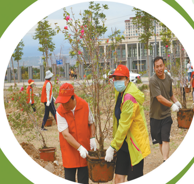
“绿化美化”志愿者在行动。

2023年,巧家县以生态美、产业兴、百姓富为目标,将着力推进“芒果+N”热区特色产业产业发展,重点突出特色果品产业与生态保护修复融合发展、共同推进。在充分合理利用荒山荒