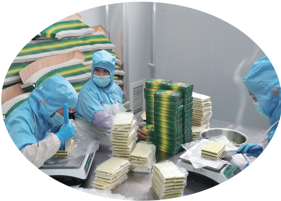
工人在制作绿豆糕。

清末,昭通人熊绍武走南闯北、走乡串巷做货郎营生时,学会了南派绿豆沙的制作技艺。在绿豆糕的制作上,南方重“蒸”,北方以模具“拓”为主,熊绍武采用二者兼具的操作办法,并以姜黄为糯米粉着色,融南北之精粹,成独特风味,逐渐形成昭通绿豆糕的特色。1925年,熊绍武以“月中桂”为名开糕点铺,绿豆糕为招牌糕点,至今已近百年。