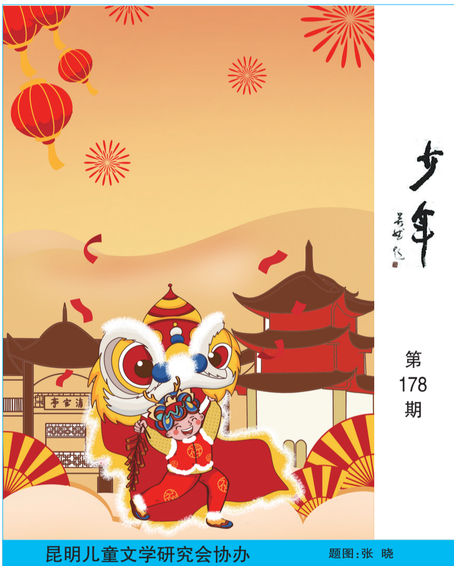
昆明儿童文学研究会协办