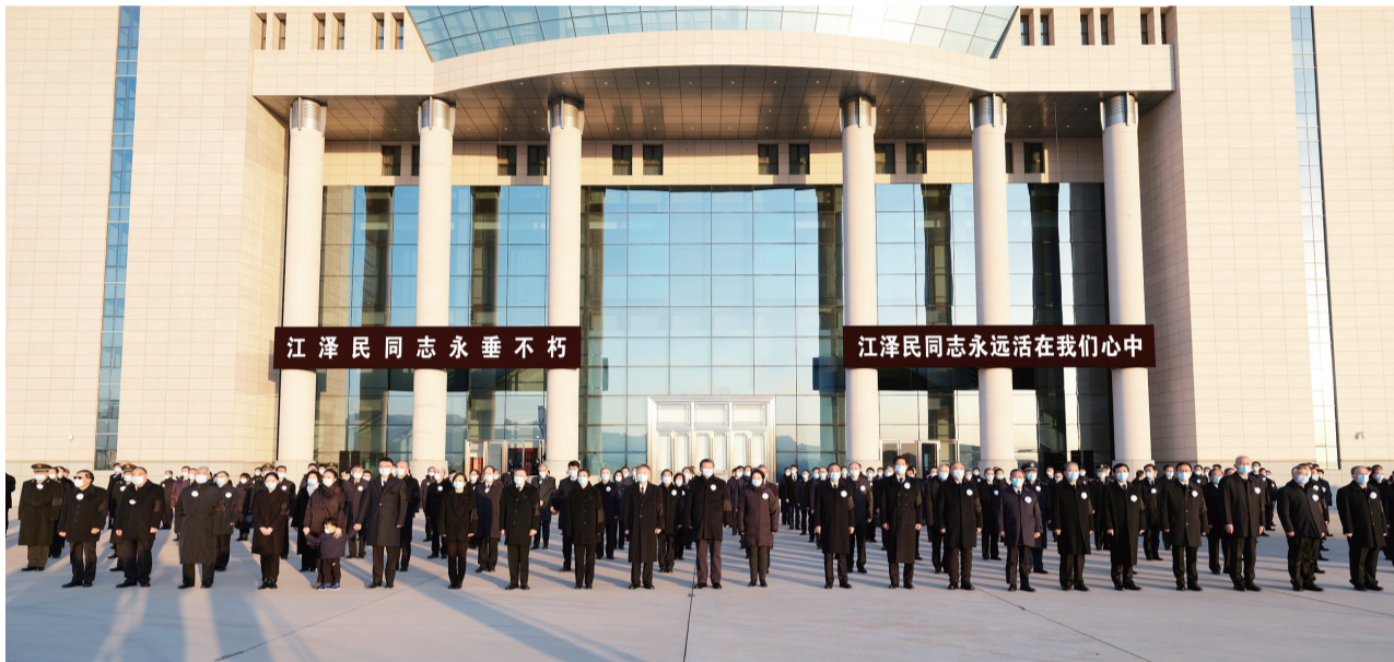
12月1日,江泽民同志的遗体从上海由专机敬移到达北京。习近平、李克强、栗战书、汪洋、李强、赵乐际、王沪宁、韩正、丁薛祥、李希、王岐山等党和国家领导同志到北京西郊机场迎灵。蔡奇等从上海护送江泽民同志遗体回到北京。

新华社北京12月1日电 我党我军我国各族人民公认的享有崇高威望的卓越领导人,伟大的马克思主义者,伟大的无产阶级革命家、政治家、军事家、外交家,久经考验的共产主义战士,中国特色社会主义伟大事业的杰出领导者,党的第三代中央领导集体的核心,“三个代表”重要思想的主要创立者江泽民同志的遗体今天从上海由专机敬移到达北京。习近平、李克强、栗战书、汪洋、李强、赵乐际、王沪宁、韩正、丁薛