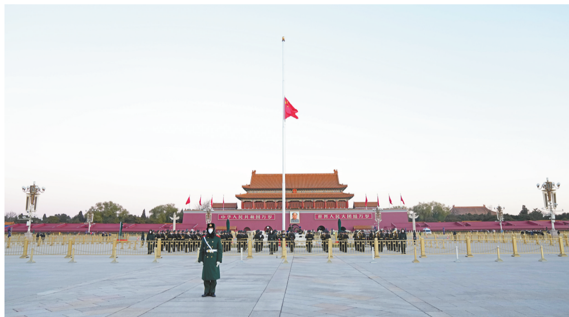
12月1日,北京天安门下半旗志哀,悼念江泽民同志逝世。

中央纪委国家监委机关、中央和国家机关工委干部职工表示,在以江泽民同志为核心的党的第三代中央领导集体领导下,我们从容应对一系列关系我国主权和安全的国际突发事件,战胜在政治、经济领域和