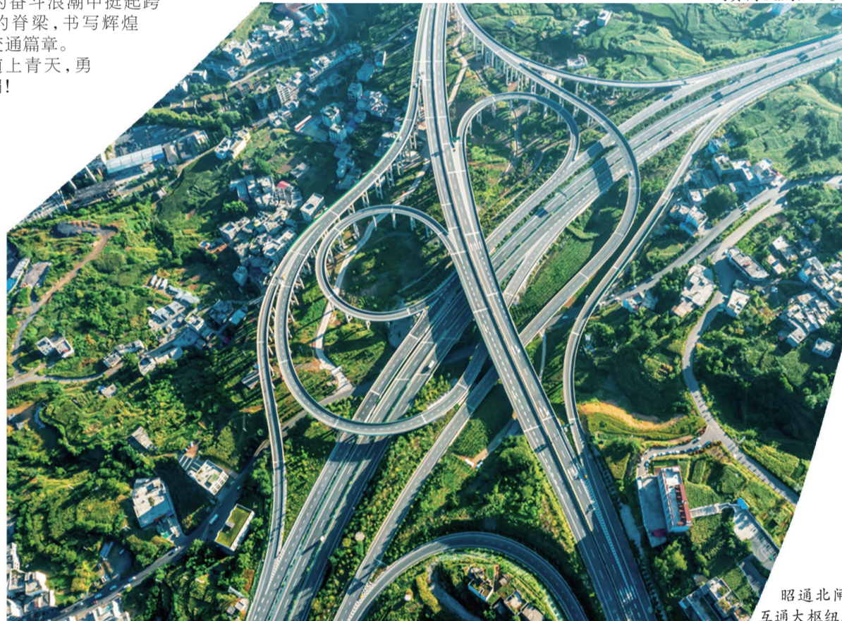
昭通北间互通大枢纽。