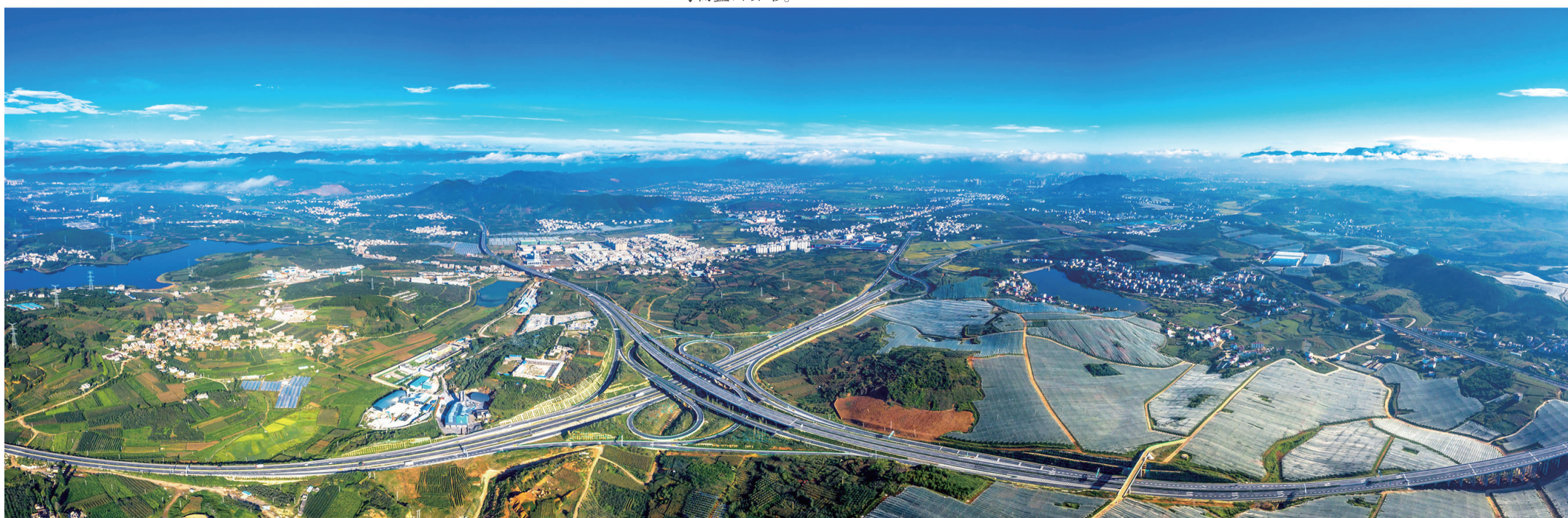
都香与银昆高速公路永丰互通。